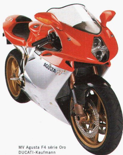
MV Agusta F4 série Oro DUCATI-Kaufmann 5037 Muhlen