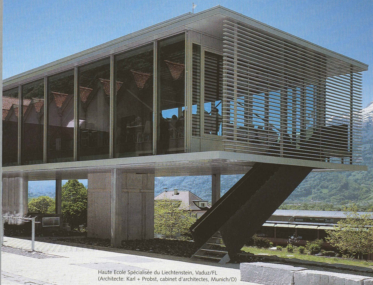
Haute Ecole Spécialisée du Liechtenstein, Vaduz/FL (Architecte: Karl + Probst, cabinet d'architectes, Munich/D)

Des solutions avec des systèmes innovants