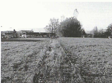
Fig. 1 : Site de Malley à Lausanne