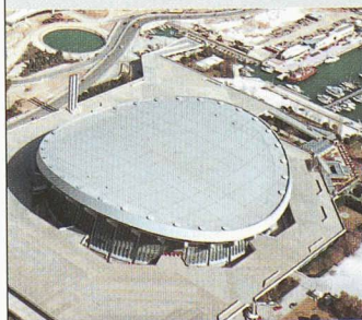
Stade Peace and Friendship

Des membranes Sarnafil à haute résistance climatique, flexibles et durables ont également été utilisées pour différents étanchements aux infrastructures des bâtiments du Centre Olympique de beachvolley et du complexe sportif (compétitions de taekwondo).