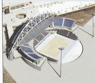
Centre olympique de beachvolley