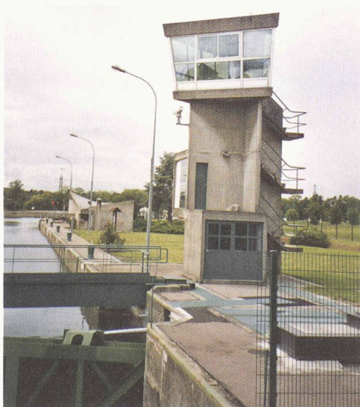
Ecluses construites par Le Corbusier à la jonction du Grand Canal du Rhin et du Canal de Huningue