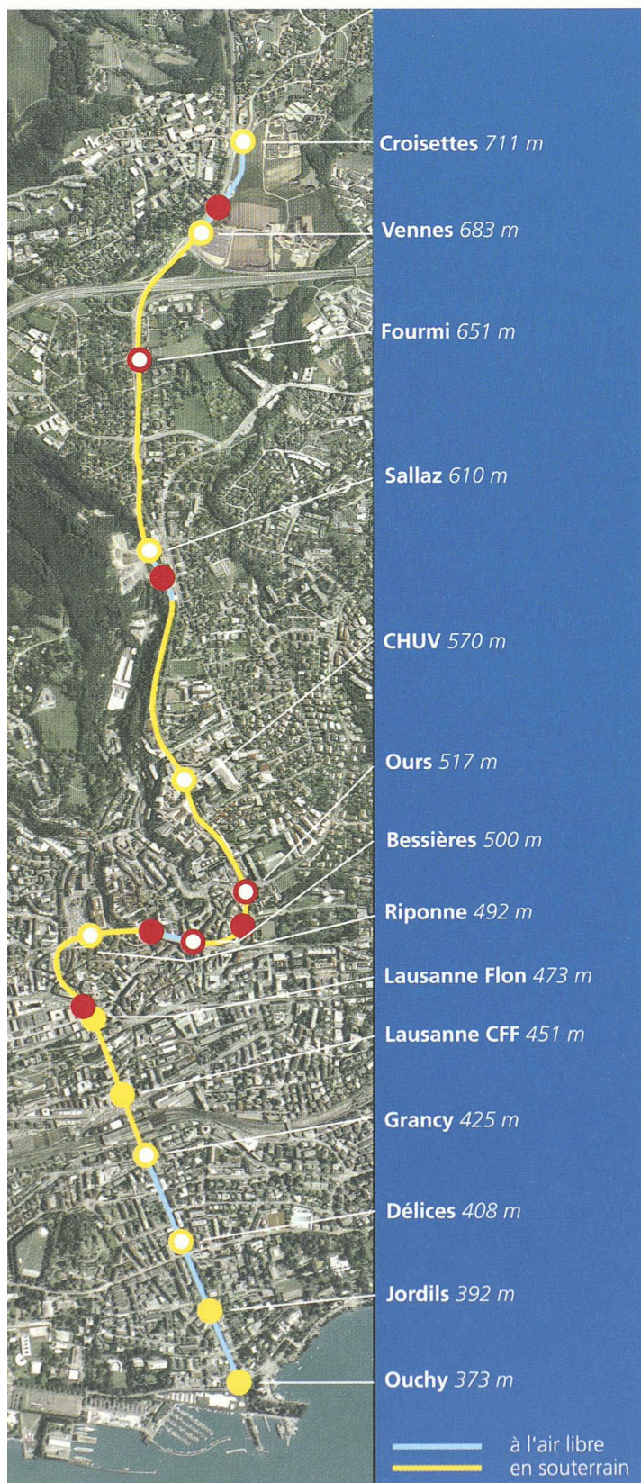
Fig. 3 : Station de Vennes

Le projet et la réalisation de ce secteur - dont les travaux ne commenceront qu'en 2006 - sont sous la responsabilité des ingénieurs et architectes du groupement SDIA.