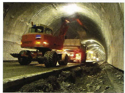
Travaux dans le tunnel de Glion

Portails Sud du tunnel de Glion - un premier pas Eric Perrette