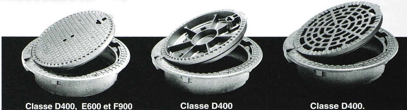
Classe D400, E600 et F900 avec ou sans verrouillage (ventilé ou non en D400).