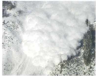
Avalanche dans la Vallée de la Sionne

Mesure par altimétrie laser héliportée Julien Vallet