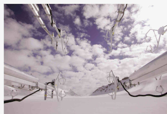
Anémomètres soniques faisant face à l'étendue du glacier de la Plaine Morte