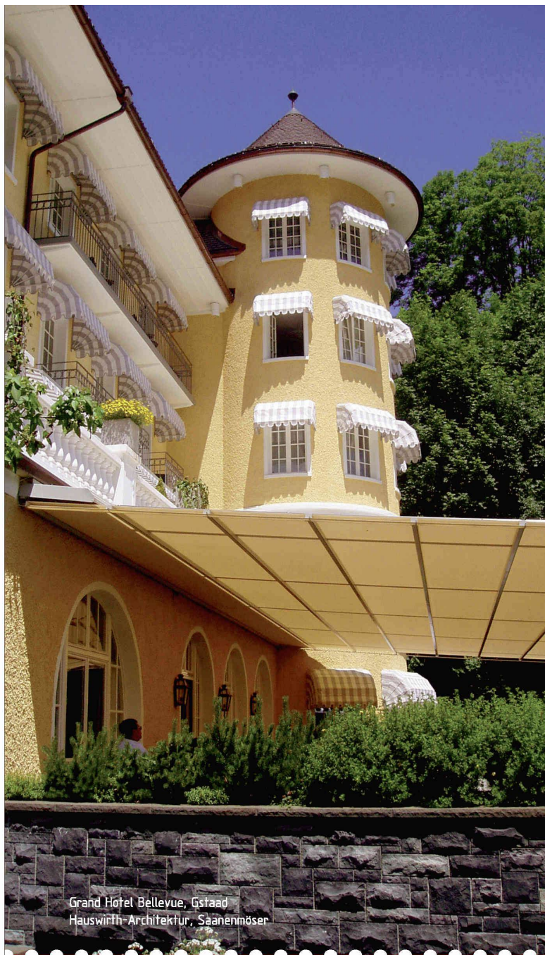
Grand Hotel Bellevue, Gstaad Hauswirth-Architektur, Saanenmöser