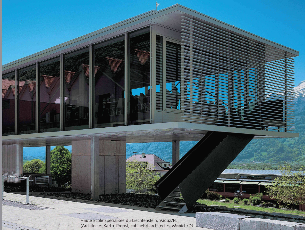
Haute Ecole Spécialisée du Liechtenstein, Vaduz/FL (Architecte: Karl + Probst, cabinet d'architectes, Munich/D)

Des solutions avec des systèmes innovants