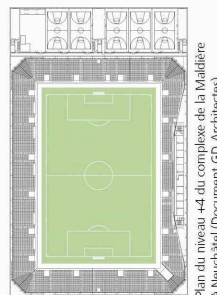
Plan du niveau +4 du complexe de la Maladière à Neuchâtel (Document GD Architects)

Dynamique de la structure des salles de gymnastique Pierre Gorgé