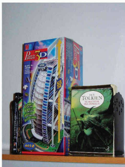
Bibliothèque d'ado incluant le Prix Wrebbitt d'architecture