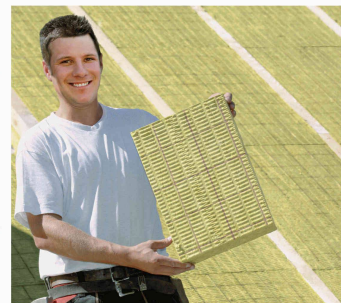
Flumroc AG CH - 8890 Flums < www.flumroc.ch >

conductivité thermique du panneau DUO de 0,036 W/mK à 0,034 W/mK. Les panneaux isolants DUO conviennent pour les façades ventilées et les murs avec briques de parement. Malgré cette amélioration significative du produit, le prix du panneau isolant DUO reste inchangé.