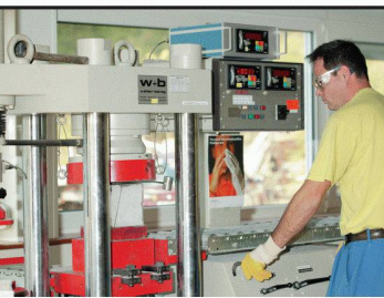
Essais sur béton frais et durci

Grâce à ses appareils d'auscultation des chaussées, ses contrôles in situ, ses laboratoires d'analyse des matériaux et l'expérience de ses ingénieurs d'étude, SACR vous offre 40 ans d'expérience pour des solutions pertinentes et économiques de gestion du patrimoine.