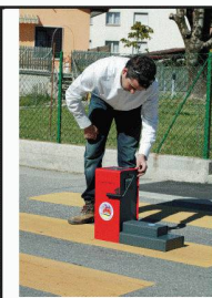
Essais sur marquages routiers