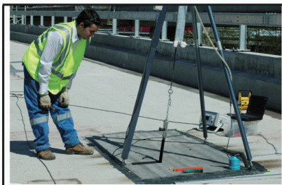
Essais sur étanchéité