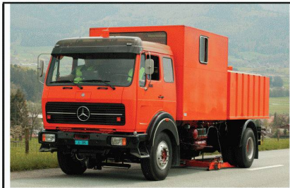
Portance et Etudes de renforcement