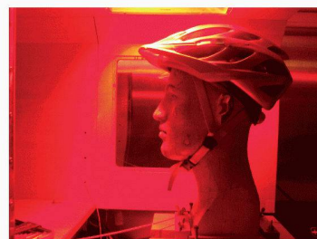
Modèle de tête avec casque de cycliste et simulation du rayonnement solaire par lampe infrarouge