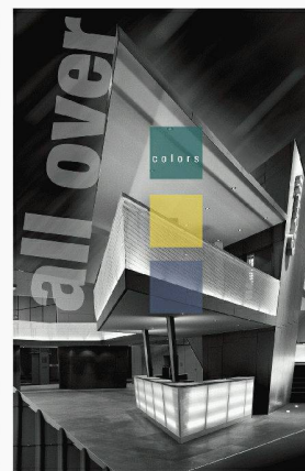
Eternit (Schweiz) AG CH-8867 Niederurnen < www.eternit.ch >

teintés dans la masse. Le stand d' Eternit (Schweiz) AG présentera en outre les produits les plus récents et de nombreuses nouveautés des domaines de la toiture, de la façade, de la construction intérieure et du jardin.