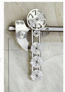
Beat Bucher AG Konstanzerstrasse 58 CH-8274 Tägerwilten < www.BucherWeb.ch >

Les surfaces coulissantes des ferrures MWE sont inusables - contrairement aux guidages en plastique, celles-ci sont totalement sans jeu et silencieuses. Ferrures de portes coulissantes en acier inoxydable et surfaces finement polies à la main offrent un excellent confort esthétique et fonctionnel. En outre, le stand présente diverses nouveautés de ferrements pour meubles et cuisines.