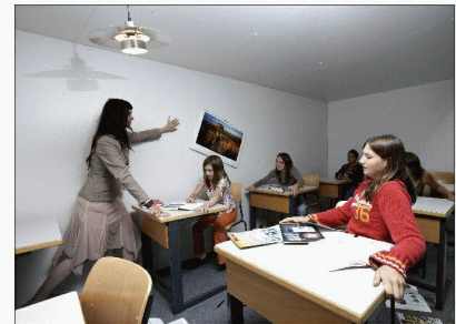
Le simulateur de séismes de l'OFEV

Sécurité sismique, aspects juridiques Walter Maffioletti