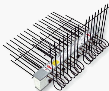
Nouveauté : Type HIT-BX-WO