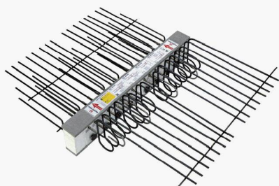
Nouveauté : Type HIT-BX-HV