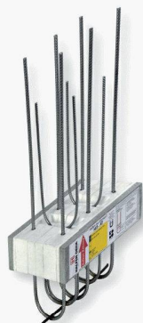
Nouveauté : Type HIT-AT

H ALFEN a élargi sa gamme de produits de consoles isolantes et vous présente ces nouveaux éléments HIT et bien davantage. Rendez-nous visite à la Swissbau 2007 afin de vous familiariser avec les nouvelles possibilités concernant les raccordements de balcons.