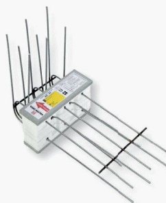
Nouveauté : Type HIT-FT