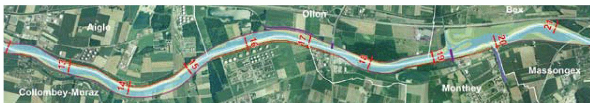
Fig. 3 : Exemples de concepts de gestion des débits : bleu foncé Q_{ext} , bleu clair Q_{100} , vert les couloirs de gestion du risque résiduel en dehors du lit du Rhône

rains sensibles à ce processus qui ont été identifiés dans les zones bâties. L'élargissement est clairement la meilleure option tant du point de vue sécuritaire qu'environnemental. Quant au rehaussement des digues, il doit rester une option de dernier recours, leur niveau par rapport à la plaine étant déjà très haut : il ne doit être utilisé que lorsque des contraintes fortes limitent les possibilités d'élargissement et/ou d'abaissement.