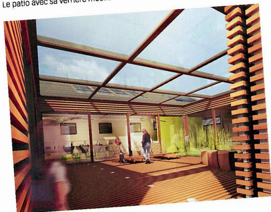
Le patio avec sa verrière mobile.