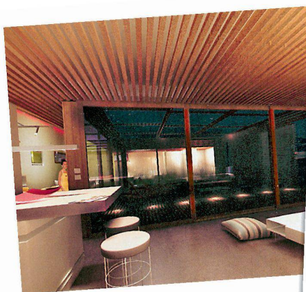
Vue plongeante sur le living depuis la cuisine.