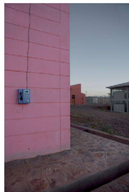
Axum, quatre des 16 bâtiments type, salles de cours, bibliothèque, auditorio et logements pour étudiants

Ruines silencieuses Francesco Della Casa