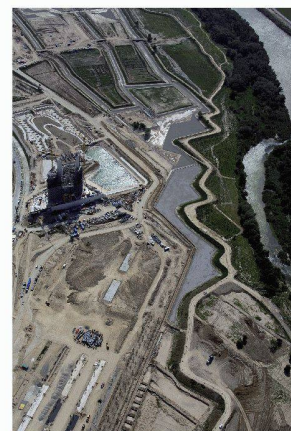
Le parc « Meandro plateado » en chantier

La Suisse et l'eau à Saragosse Jacques Perret