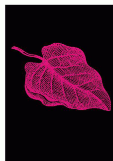
Cocculus lacunosus (Document Atelier Poisson)

Projets primés du concours international Francesco Della Casa