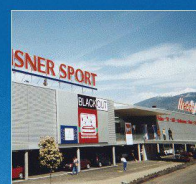
Media Markt, Conthey