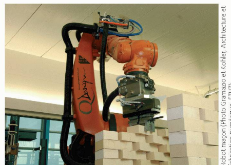
Robot maçon