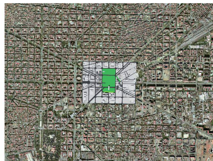
Nouvelle Plaza de Glories à Barcelone

Barcelone, les enseignements d'un laboratoire urbain Léopold Veuve