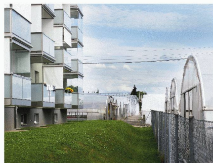
Paysage de périphérie

Nouveaux espaces publics : les projets d'Europarc 9 en Suisse Francesco Della Casa