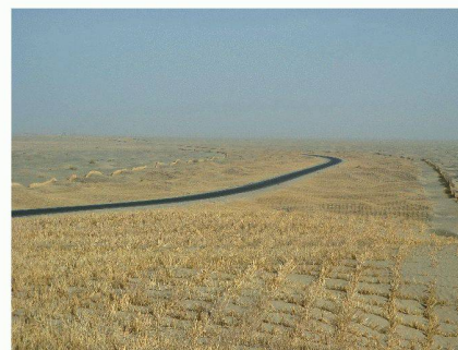
Autoroute du Taklamakan