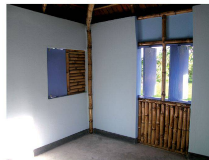
Construction vernaculaire avec ossature en bambou