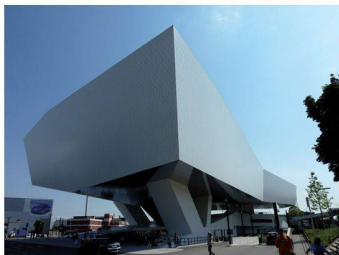
Le musée Porsche