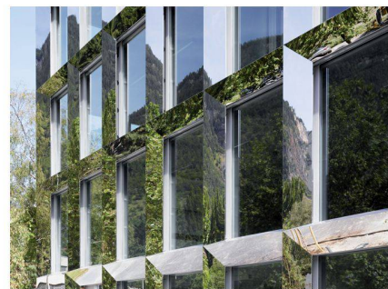
Façade de l'école professionnelle du Haut-Valais à Visège, Bonnard & Woeffray Architects

Un atlas du logement on-line Cédric Bachelard