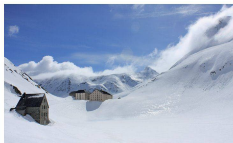
Col du Grand-Saint-Bernard depuis la frontière italienne

Retrouver la route du col du Grand-Saint-Bernard Yves Molk et Christian Hagin Le printemps des routes de montagne Jacques Perret