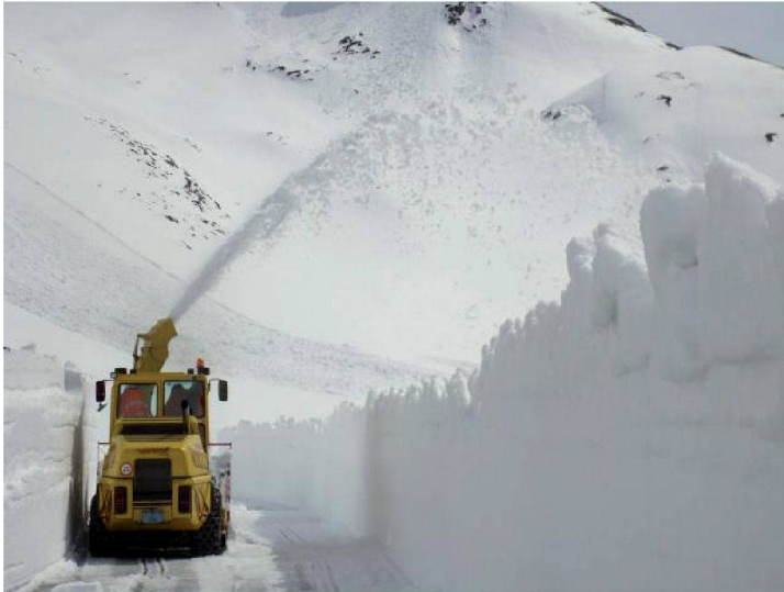
Fig. 4 : Piquetage printanier en vue de l'ouverture de la route