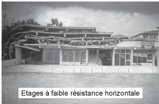
Etages à faible résistance horizontale