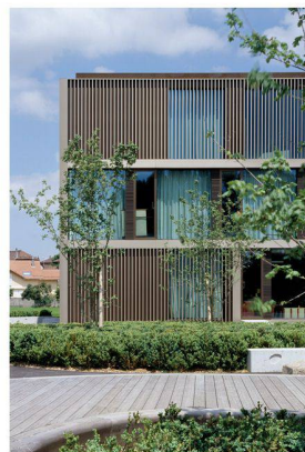
Le collège du Marais-du-Billet à Cheseaux-sur-Lausanne, du bureau Mähni+Capua-Märki