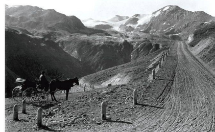
Route du Col de l'Umbral, GR