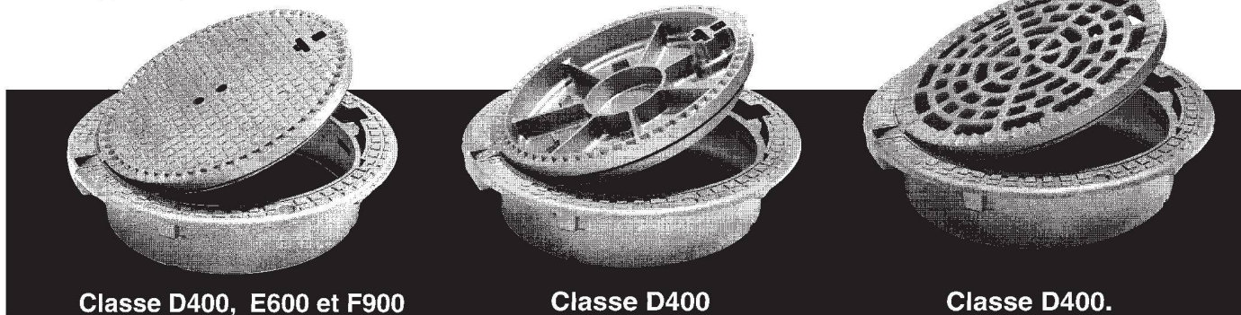
Classe D400, E600 et F900 avec ou sans verrouillage (ventilé ou non en D400).