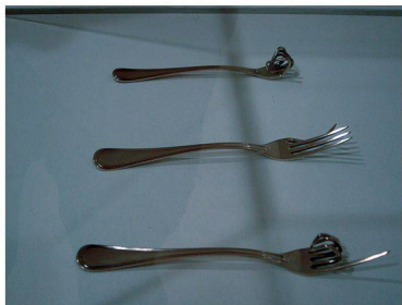
Des «Fourchettes parlantes» selon Munari