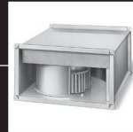
Ventilateurs centrifuges à action