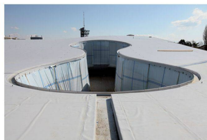
Patio du Rolex Learning Center