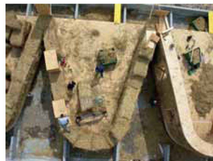
Essehof, maison de vacances à Lana, Italie du Nord, architecte: Werner Schmidt, coll. Margareta Schwarz

Deux constructions en botte de paille en Suisse romande Elsa Cauderay, Julien Hosta et Marco Sonderegger