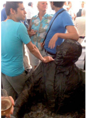
Montreux Jazz festival 2010