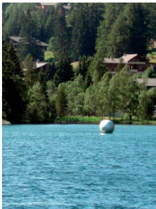
Lac Champex, Valais