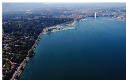
Photomontage de la grande rade avec le projet de port, plage et parc publics des Eau-Vives