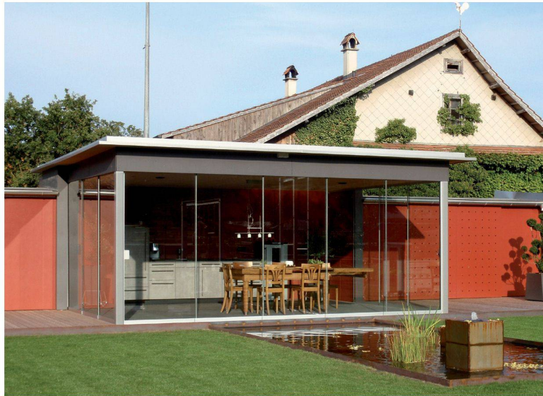
Profilés en aluminium. Montage facile et rapide. Paroi coulissante en verre plein VG15 avec ESG 8 +10 mm.