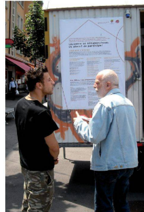
Démarche participative à Lausanne