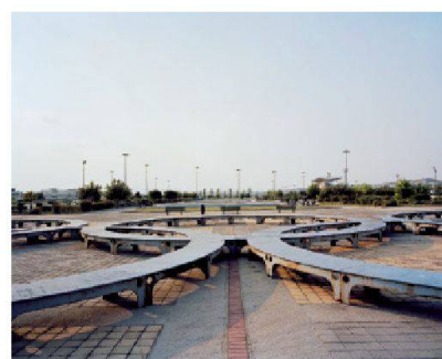
Les cerceaux olympiques rouillés

Athènes, l'émergence de la ville post-fordiste Yorgos Tzirtzilakis