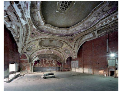
Détroit, théâtre abandonné reconverti en parking

La ville - invisible, décriée, maltraitée Yvette Jaggi