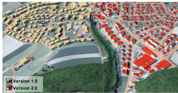
Visualisation des deux versions de swissBUILDINGS 3D avec swissALTI 3D , SWISSIMAGE et swissTLM 3D – Nürensdorf (ZH)

Dès 2012 swissBUILDINGS 3D 2.0 sera disponible selon les régions. Cette version qui intégrera la forme des toits et comptera plus de bâtiments que la version 1.0 sera régulièrement mise à jour au même rythme que swissTLM 3D .