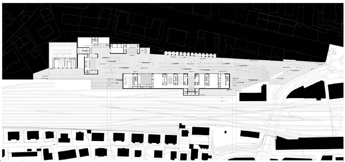
6 PLAN GÉNÉRAL DU REC DE CHASSE 1:500

L'intérêt n'est pas tant dans la valeur patrimoniale des édifices, que dans l'éthique et l'enseignement qui émane de leur reconversion. Une société qui sait s'accommoder de ces